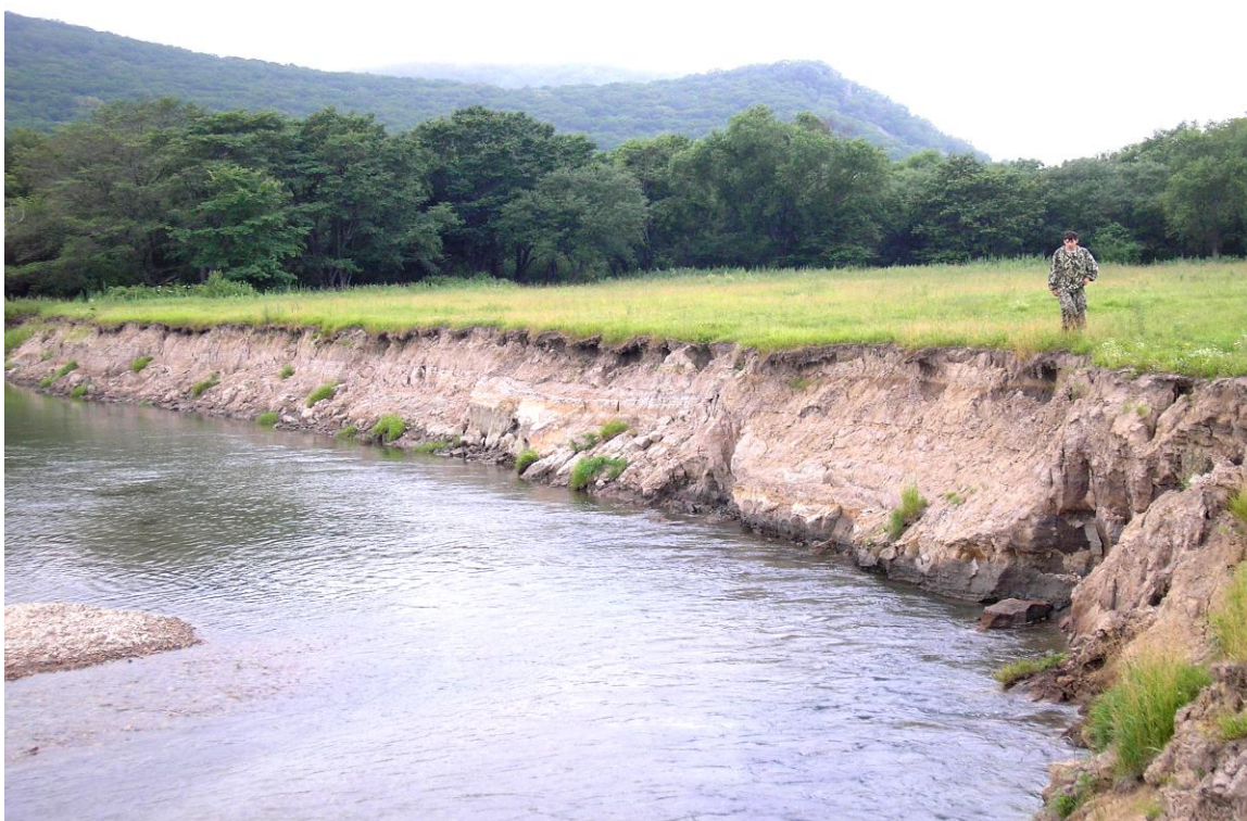
Рис. 2. Обнажение аккумулятивной террасы на правом берегу р. Арзамазовки в районе изученного разреза

Пыльца травянистых растений во всех типах отложений чаще всего представлена осоками, полынью и злаками, реже разнотравьем; споры – папоротниками Polypodiaceae и, в меньшей степени – Osmunda .