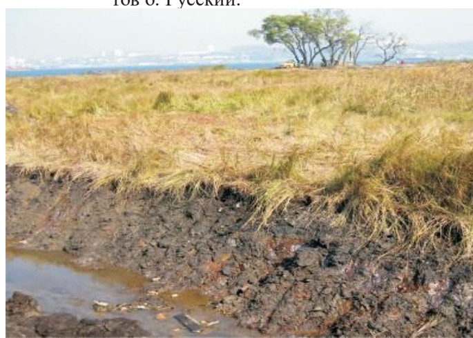
Рис. 2. Низкая лагунная терраса на северном побережье о. Русский на геоморфологической схеме (слева) и в районе разреза «Поспелово»:

1 – пляж; 2 – галечная пересыть высотой 2 м; 3 – аккумулятивная лагунная терраса высотой 1,5 м; 4 – холмы; 5 – населённый пункт