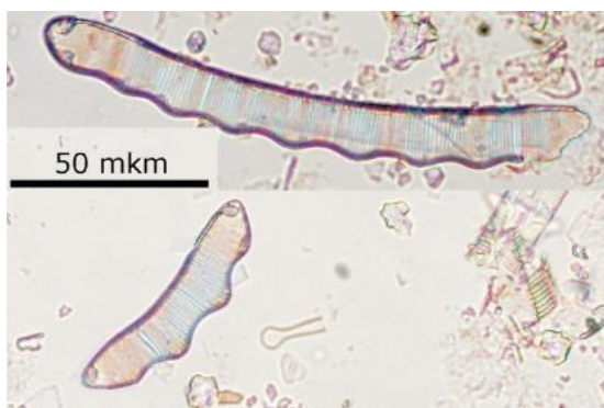
Рис. 4. Тропическая диатомея Eunotia monodon var. tropica (Hustedt) Hustedt в отложениях торфяника «Поспелово»

4. Дальнейшее развитие болота протекало при периодическом затоплении речными водами, что видно по включению гнёзд супеси и прослоя гравия в горизонте тростникового торфа в интервале 180–190 см. СПК Po-4 фиксирует рост пыльцы ольхи (26–41 %) и сокращение пыльцы широколиственных деревьев, по сравнению с предыдущим комплексом (рис. 3). Содержание пыльцы дуба падает в 1,5–2 раза (до 23–34 %), термофильного граба – в 2–3 раза (до 5–6 %). Комплекс отразил произрастание широколиственных лесов с преобладанием дуба и распространение ольховников, роль которых в растительности острова приблизилась к современной. Климат стал