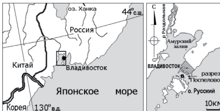
Рис. 1. Схема расположения разреза «Поспелово» на о. Русский