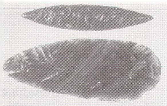
Рис. 1. Obsидиановые наконечники (из коллекции Н.А.Коновенко, ИИАЭ ДВО РАН)

Африка. Существует Международная ассоциация по изучению обсидиана (штаб-квартира находится в Университете Калифорнии, г. Сан-Хосе, США). В настоящее время в археологических исследованиях актуальной является проблема реконструкции характера эксплуатации коренных источников обсидиана в древних культурах (с эпохи палеолита до этнографической современности). Под этим по-